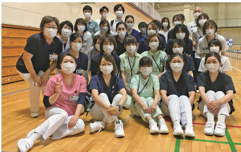
7月・8月に函館大学にて、新型コロナワクチンの職域接種を実施しました。