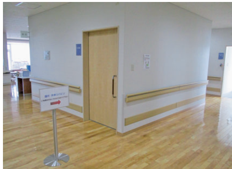
リハビリテーションセンター入口