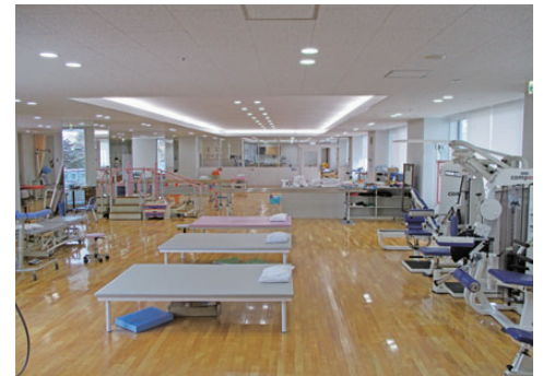
リハビリテーションセンター内