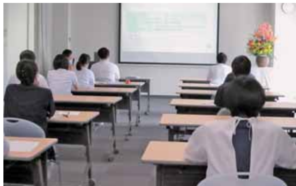
オリエンテーションの風景▶