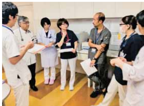
緩和ケアチームカンファレンスの様子